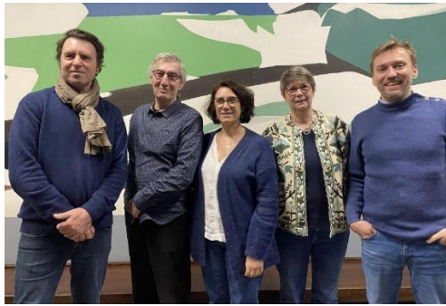
Jury 2025 – Prix Croire au cinéma

Le jury a visionné les huit films finalistes :